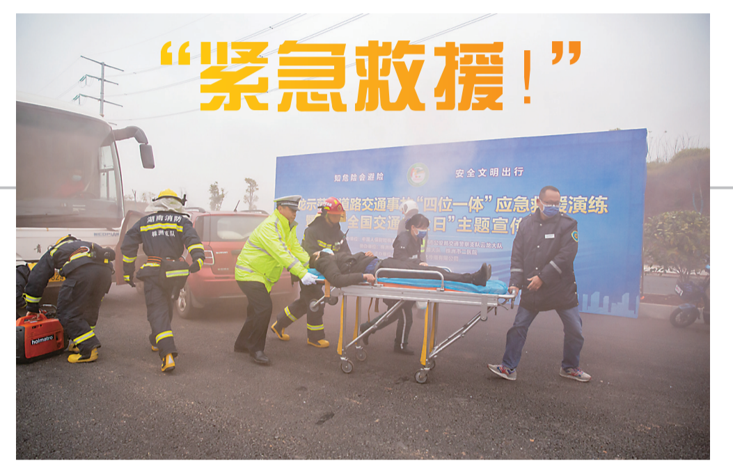
▲应急救援演练现场

今年以来,石峰区整合民政、残联等部门项目资源,集中对符合条件的家庭进行“适老化”“无障碍”改造,截至目前已有60户家庭受益。记者了解到,“无障碍”改造主要针对有残疾人的家庭,石峰区残联已摸清政策适用对象底数,正在逐步实施改造。“适老化”改造则面向广大有老人的家庭。该区民政局相关负责人介绍,“适老化”改造遵循“自愿改造+政府补贴”的模式,改造内容包括:地面改造(做防滑处理、填补高低落差等,提高安全性)、卧室改造(安装床边护栏,辅助老年人起身)、如厕洗浴设备改造(安装安全扶手、沐浴椅、蹲便器加装坐便椅或更换坐便器)、老年用品配置(配置手杖、加装安全监控装置,实现智能化照护预警)等等。哪些家庭可以申请进行“适老化”改造呢?上述负责人介绍,具有石峰区户籍的,纳入分散供养特困人员和城乡低保对象中的高龄、失能、残疾老年人家庭,60岁以上失能、65岁以上半失能和80岁以上空巢低收入老年人家庭等可以提出申请,申请者联系所在社区的网格员即可。(记者 李卉 通讯员 杨湘黔)