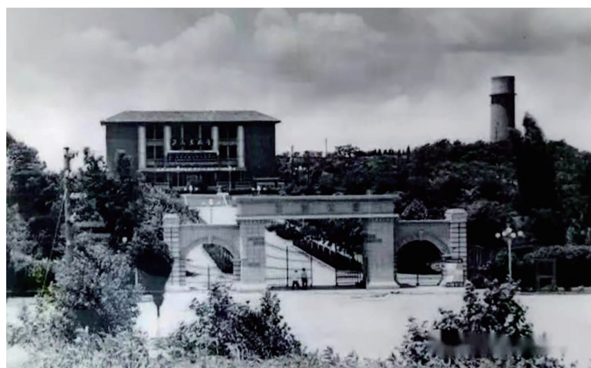
▲原奔龙公园里的永利水塔

大凡上了年纪的株洲人知道,株洲的奔龙山上以前有一座标志性建筑——永利水塔。每当心底泛起儿时的回忆,永利水塔的影子也就浮现在眼前。