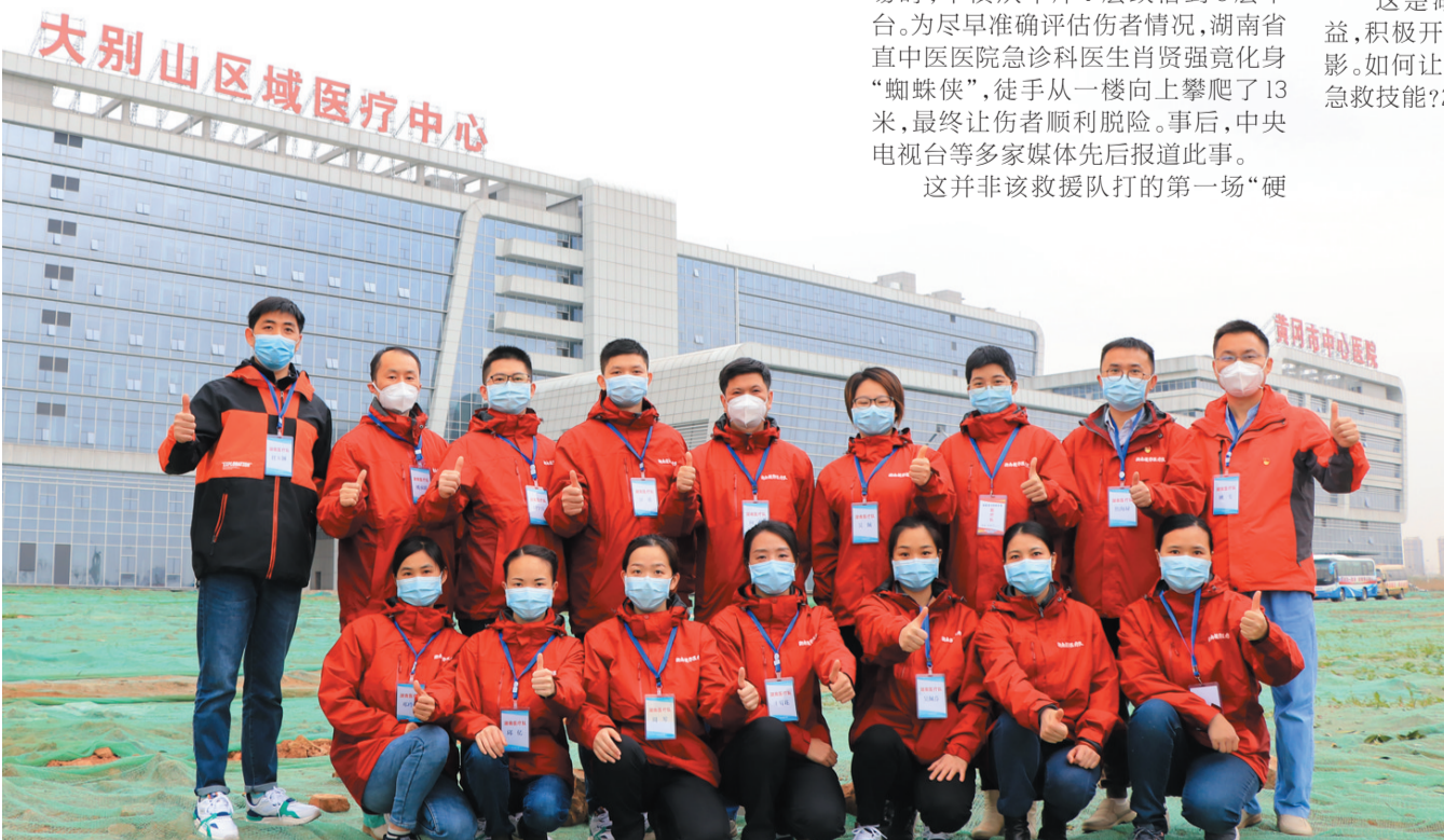
▲省直中医医院16名医疗队员驰援黄冈。