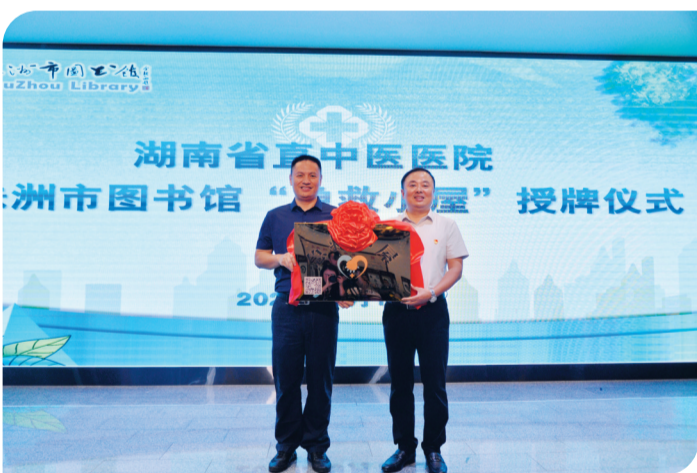
▲9月16日,省直中医医院在株洲市图书馆成立全市首家急救小屋。

首都医科大学附属北京中医医院、山西中医药大学附属医院、河南省中医院……记者整理发现,此次入选中医紧急救援“国家队”的33家医院几乎都是国内顶尖的中医医院,而湖南省直中医医院是我省唯一“入选”的中医医院。