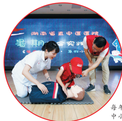
▲省直中医医院每年定期举办全市中小学生急救培训公益活动。

灵活机动,则是该院救援队最大优势所在。开展救援时,成员可根据需要随时随地展开帐篷医院,对伤者展开救治。