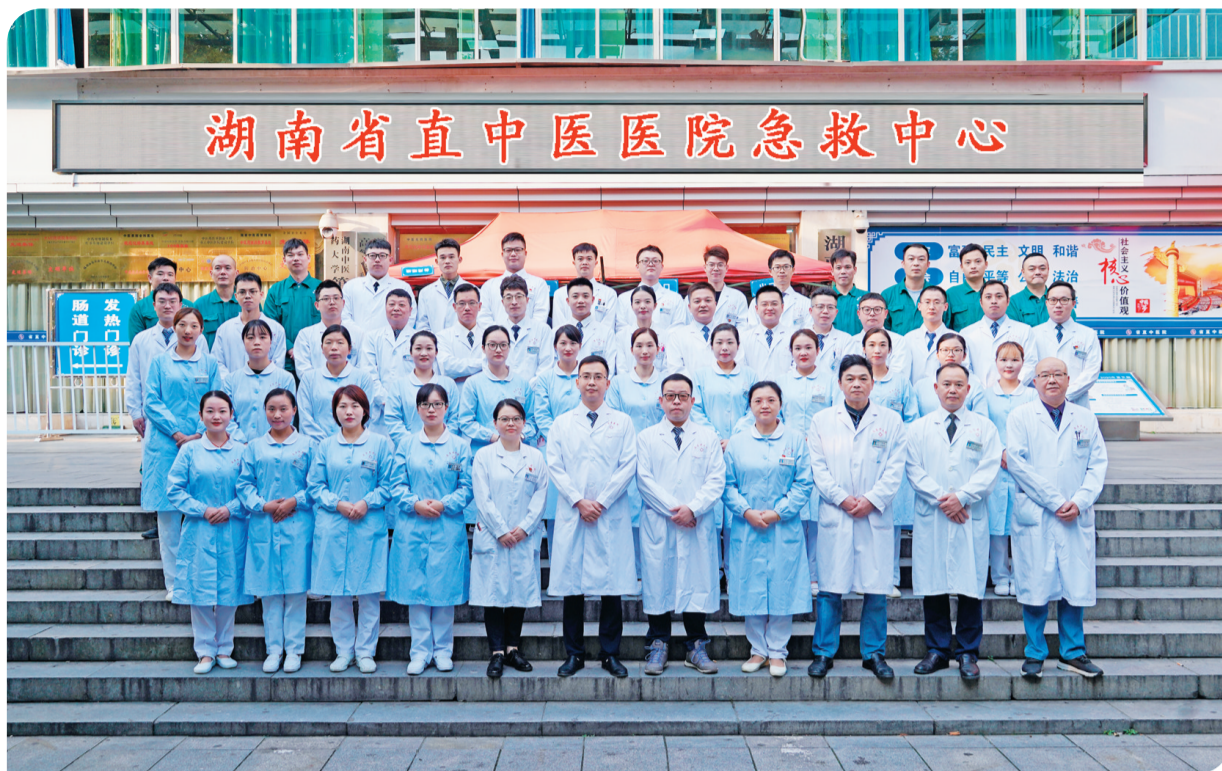
▲省直中医医院急救中心团队合影。

湖南省直中医医院为何能入选中医紧急救援“国家队”?它的底气何在,这支救援队有啥特点和功能?记者为您一一揭晓。