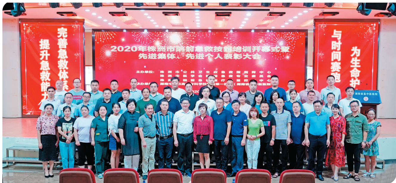
▲省直中医医院举办全市院前急救技能培训大会。