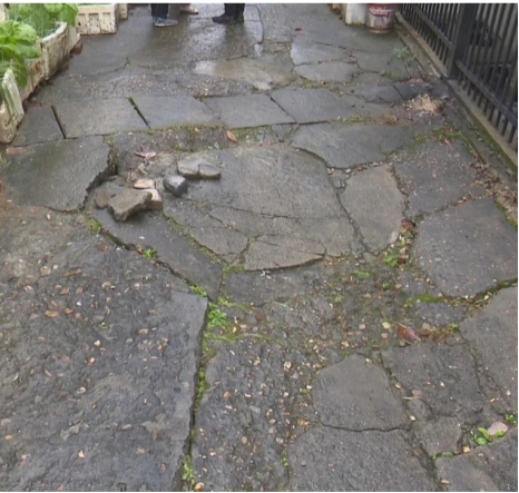
▲散户居民出入通道局部已经塌陷

唐雅也承诺,由社区组织居民筹工筹劳彻底解决问题,如果还缺少费用,再申请当地街道予以支持。协商结果让沿线居民十分满意,表示会尽全力协助。