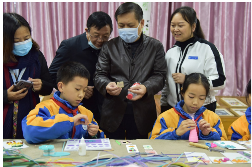
▲在泰山学校,同学们与专家学者们友好交流

本报讯(记者 黄欣雨)11月25日-27日,第八届中国中部六省炎黄文化论坛在株洲举行。会议期间,各省专家学者一行参观了“炎帝文化进校园”试点的天元区泰山学校,深入了解该校试点工作进程与工作经验。