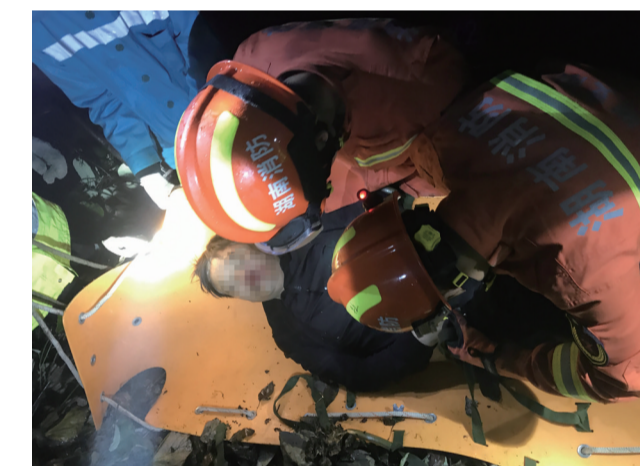
▲消防员将伤者抬上担架

消防员说,还好山坡上的植被对轿车起到缓冲作用,再加上地面松软,伤者没有生命危险。目前,伤者正在住院接受治疗,事故原因还在调查中。