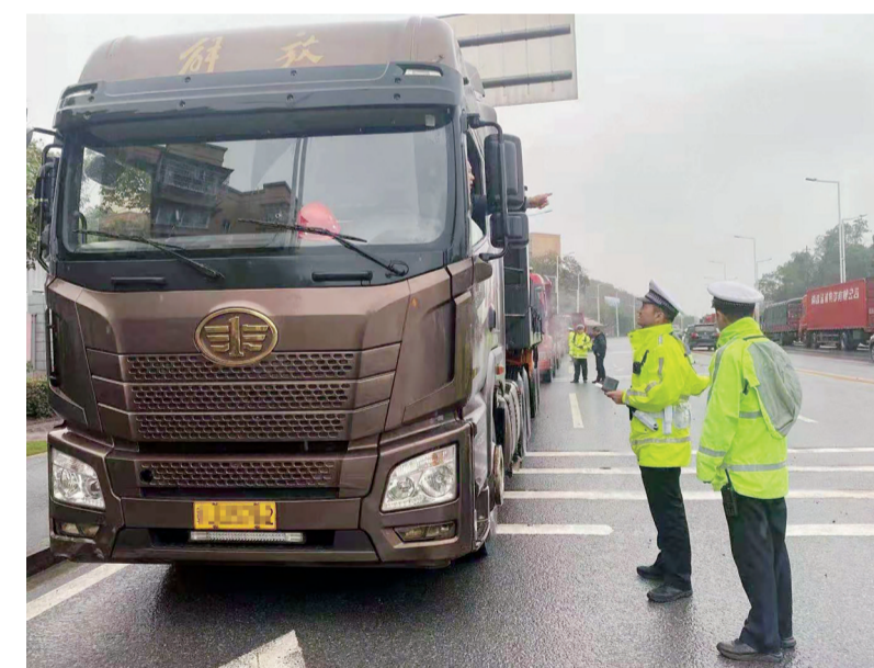
▲交警对机场大道上的货车开展检查 通讯员供图