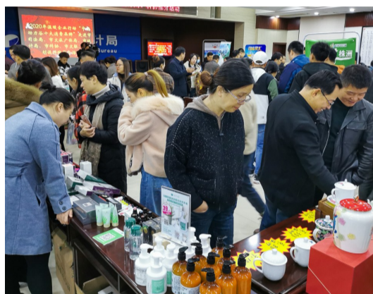
▲活动现场人气旺

本报讯(记者 黄欣雨 通讯员 李茂春)“唐人神腊鸭才29元一包,比外面便宜好多,我买了5只。”收获满满的裴女士说。昨日,株洲市“2020年温暖企业行动中国动力谷十大消费品牌”走进市司法局、市文旅广体局、市统计局等部门,开展为期一天的推介活动。