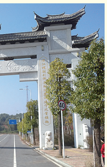
▲位于涪口区南洲大道的得志公园(资料图)

声粗气地嚷道:“算老子倒霉,栽在你们这群王八羔子手上,反正正给他包扎伤口,他硬是不让,还骂骂咧咧地说,你们这是打的啥仗?背后放暗箭要阴的,算啥本事!”