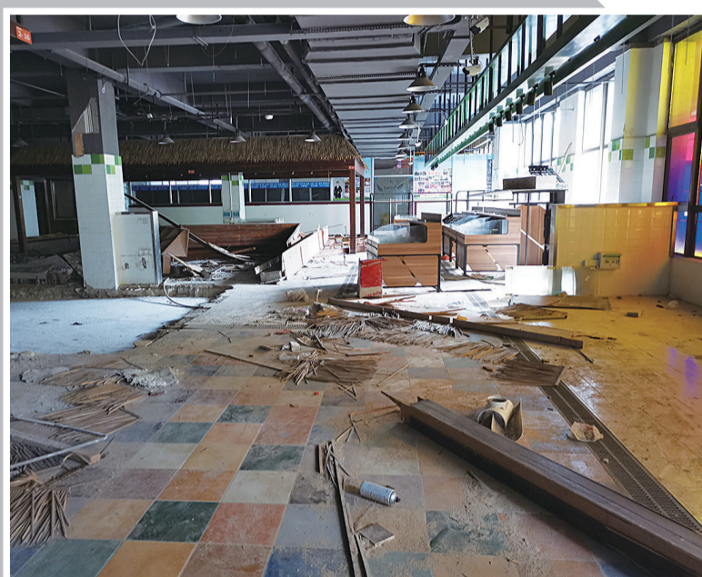
▲位于世贸广场的多米新街市,部分摊位已经停摆