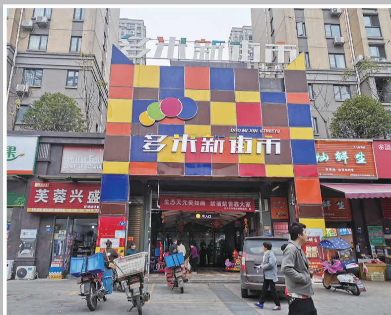
▲多米新街市九八锦景城店(资料图)