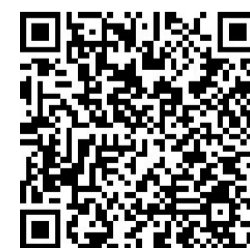
▲扫码看采访视频 视频制作:谢慧