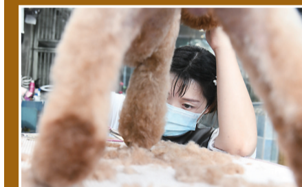
▲宠物美容需要耐心和专注力