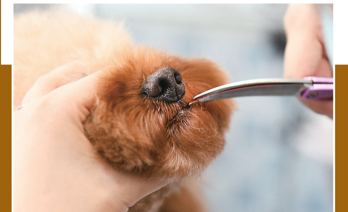
▲修剪嘴巴周围的毛毛