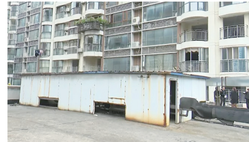
▲鸿远足浴店在楼台搭建的机房紧邻业主阳台