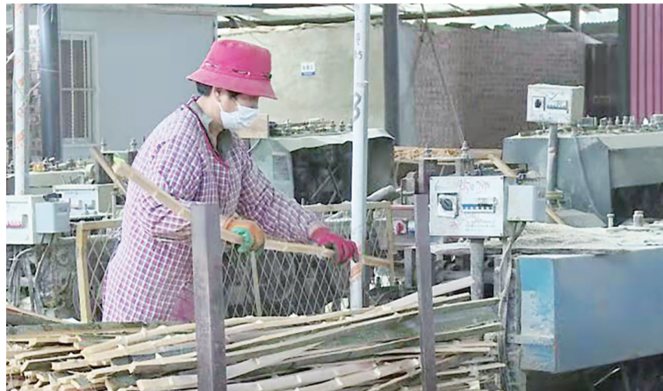
▲半机械化的生产流程让工厂和工人获得了更高的收益 通讯员 供图

针对乡村“供血能力”不足和贫困群众就业渠道不宽等问题,攸县通过政策扶持,因地制宜利用县域优势资源,培育壮大特色产业扶贫车间,着力推动项目带户、车间带富。