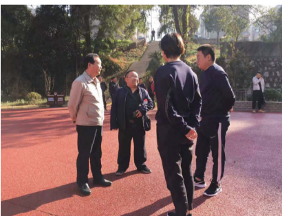
▲改造而成的休闲广场

据了解,以往这儿杂草丛生,垃圾乱石成堆,还有不少外来租户在此种上了蔬菜。自2018年起,戴家岭村以打造宜居环境、建设美丽乡村为目标,集中治理环境脏、乱、差现象,推动环境卫生、休闲文化等基础设施建设,农村人居环境有了显著改善。