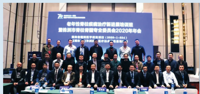
▲与会嘉宾、专家及株洲市脊柱脊髓专委会委员合影

11月13日至14日，由株洲市医学会脊柱脊髓专业委员会和株洲市三三一医院共同主办的“湖南省继续医学教育项目——老年性脊柱疾病治疗新进展培训班暨株洲市医学会脊柱脊髓专业委员会2020年年会”顺利召开。