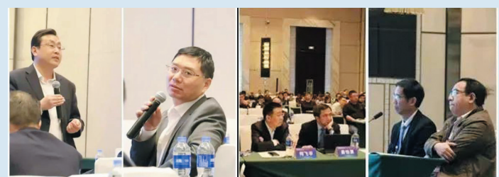
▲整个会场学术气氛浓厚，讨论热烈

现代社会，人口逐渐进入老龄化，老年性脊柱疾病发病率逐年增高。举办本次会议是为了提高我市脊柱外科同仁对老年性脊柱疾病的诊疗水平，规范各种脊柱外科诊疗技术。