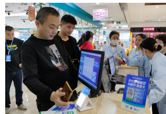
▲市民出示医保电子凭证动态二维码购药