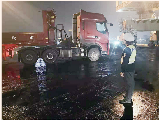
交警夜查株洲港超限超载行为。