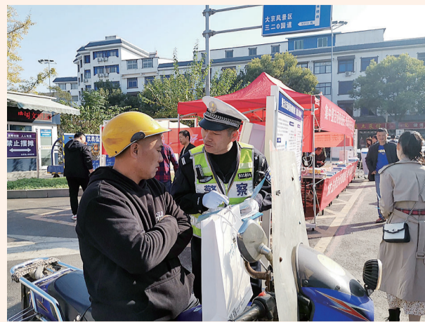
集中宣传活动进乡镇。