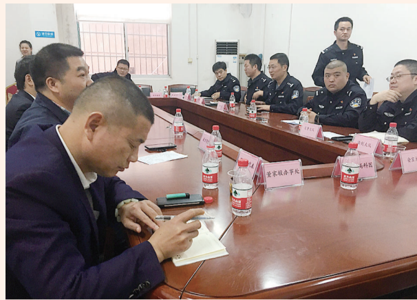
11月6日,市公安局交警支队组织多方代表召开座谈会,共商治理机场大道安全隐患。