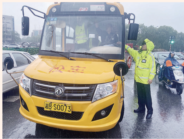
突击检查,保障校车安全。受访者供图