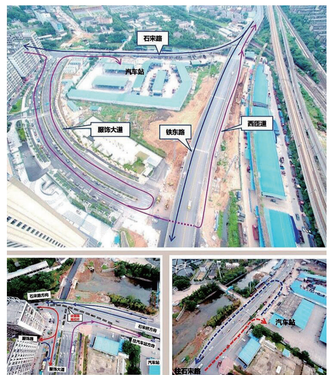
石宋路高架桥区域交通组织示意图。