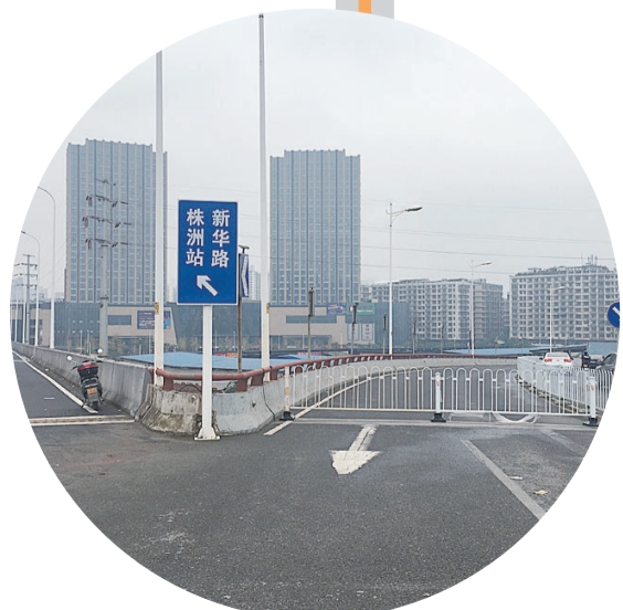
石宋路高架桥由东往西方向车道实施封闭。