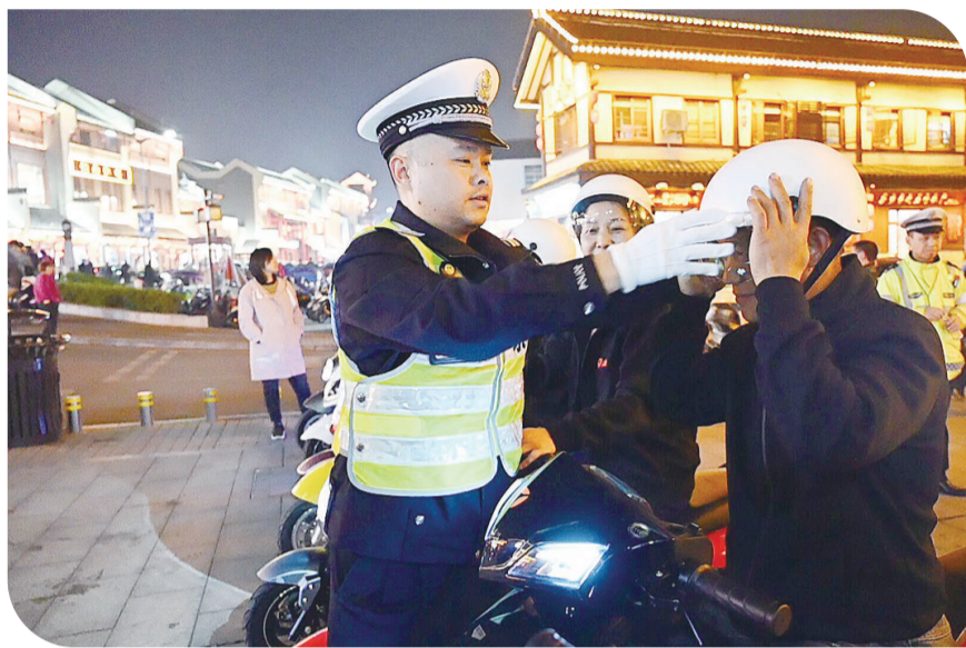
交警开展“一盔一带”宣传,并为驾驶员送头盔。

本月,集中整治行动进入攻坚收尾阶段,整治工作开展情况及行动中遇到的整治难点受到市民关注。交通问题顽瘴痼疾“顽”在哪?有哪些“硬骨头”?近日,记者对整治活动开展以来的情况进行了梳理。