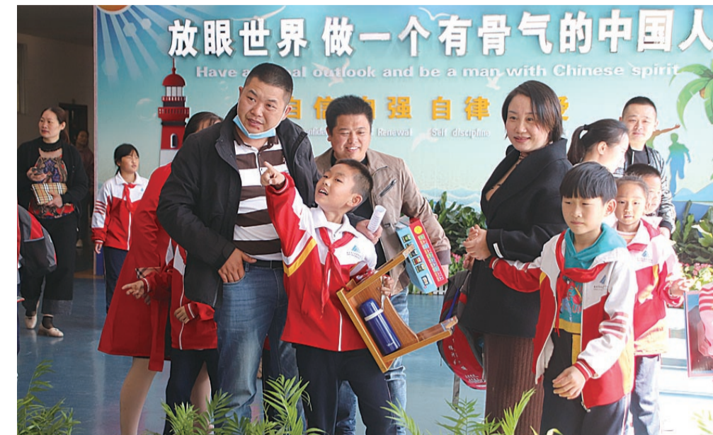
▲家长会上,孩子带父母逛校园

本报讯(记者 何春林 通讯员 李晓亮)14日,荷塘外国语学校小学部举办了一场别开生面的家长会:家长和孩子们一起坐在教室,观看和点评教师们上课;教师和家长开会时,孩子们则聚在一起看电影。