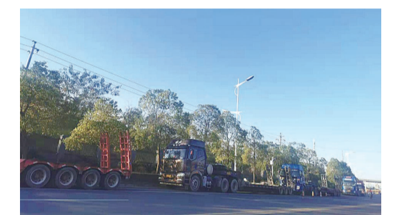
▲新东路栗雨小学路段,经常停放着大型运输车辆