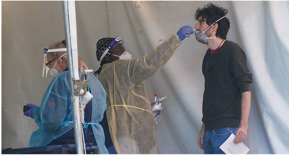
▲当地时间11月13日,美国华盛顿的一处新冠病毒检测点的医务人员在收集检测样本

美国疾病控制和预防中心当地时间13日公布的数据显示,全美12日报告新增新冠确诊病例194610例,连续第五天刷新全球范围内一国单日新增确诊病例最高纪录。