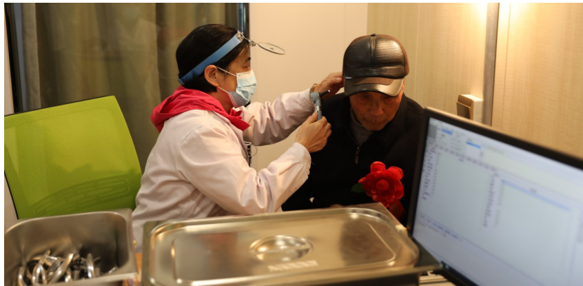
重点优抚对象在进行健康检查。