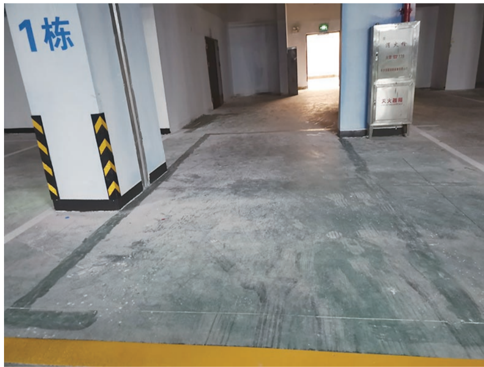
▲地下车库通往电梯间的过道上,车位线已经被铲掉

近日,金轮·津桥华府有业主拨打晚报新闻热线28829110反映:我们是一期业主,明年1月份交房。现在我们发现项目有一些问题,比如用普通玻璃代替钢化玻璃、双入户大堂变电梯间、商铺往小区内开后门,小区没有幼儿园。