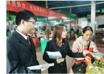
▲检察干警现场发放宣传资料

本报讯(记者 贺天鸿 通讯员 肖琼)为深入推进“公益诉讼守护美好生活”专项监督活动,切实做好检察公益诉讼环节服务保障“六稳”“六保”工作,近日,芦淞区人民检察院立足检察监督职能,与区市场监督管理局组成检查组,开展食品药品安全执法检查。