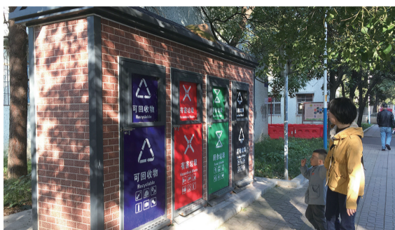
滨江社区,在停用的垃圾分类投放箱前,一名家长在教小孩垃圾分类。刘平 摄

“垃圾分类从我做起”“城市美容师有了新时尚——垃圾分类”……目前,倡导垃圾分类的宣传标语成为不少居民小区和大街小巷的风景;有些居民小区