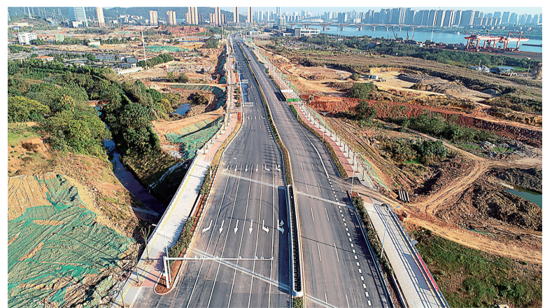
俯瞰清水塘二期道路。全媒体记者 潘浩瀚 摄

清水塘生态科技新城二期道路。这不仅仅是一条片区城市干道，更是一条串通新旧动能转换、产业招商、绿色发展的产业大道。