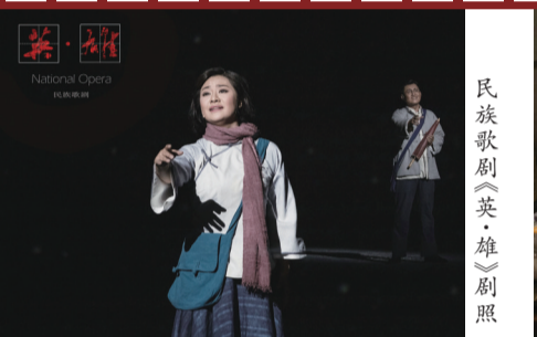
民族歌剧《英·雄》剧照