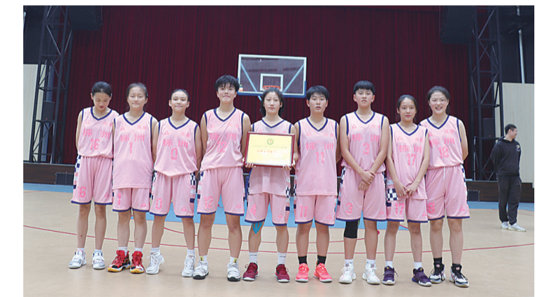
▲初中女子篮球队队员合影

11月8日,株洲市“三好杯”篮球赛落下帷幕,株洲南雅初、高中女子篮球队在教练员的带领下,拼搏进取,力克强敌,均以大比分赢得比赛,勇夺冠军。