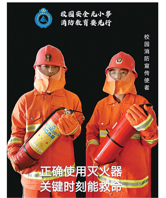
正确使用灭火器 关键时刻能救命

当火警信号响起,老师组织学生快速从宿舍楼疏散至操场安全区域。孩子们捂住口鼻,弯腰前进,迅速撤离“火灾现场”,整个疏散过程安全、有序。