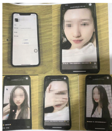
▲ 张某在朋友圈中发的“自拍”