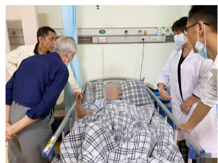
▲ 医护人员为老人量身定制治疗方案

本报讯(记者 杨凌凌 通讯员 陈志梧)刘爹爹是一位空巢老人,今年年初出现下肢乏力、皮肤溃烂等病症。结果老人硬扛,直到老同事上门来探望才发现其腿部创面已生蛆。老人被送入市人民医院后,医院开启了绿色通道,让老人获得了有效救治。