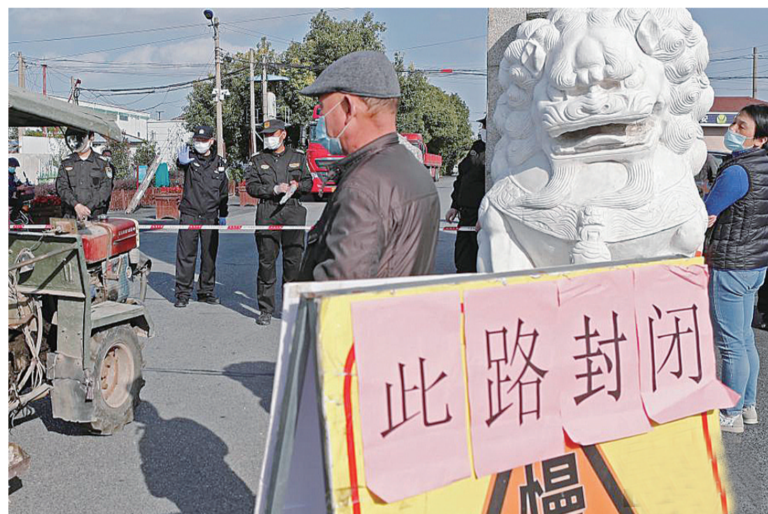
▲ 营前村灵通路路口已被封闭,行人、车辆只进不出

据上海市政府新闻办公室官方微博消息,在9日下午举行的上海市疫情防控工作领导小组新闻发布会上,上海浦东新区通报一例新冠肺炎确诊病例;上海市卫健委透露,浦东祝桥镇营前村列为中风险地区,上海其他区域风险等级不变。