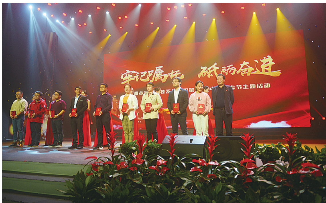
▲市优秀新闻工作者代表上台领奖

本报讯(记者 戴凇)牢记嘱托、砥砺奋进。昨日,由市新闻工作者协会主办,市广播电视台和株洲日报社承办,市新闻宣传系统2020年记者节主题活动举行。活动中,表彰了2020年度市优秀新闻工作者、市宣传系统抗疫一线先进工作者等。