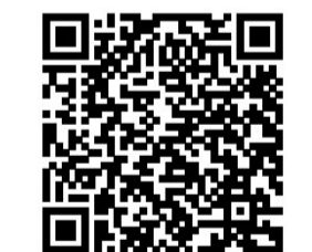
▲微信扫码直接购买

规格:家庭装(净重5斤) 价格:家庭装(36.8元) 限时特惠:2件立减8元(截至11月15日)