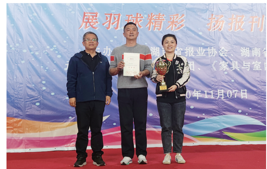
▲株洲日报社代表队队员(右一、右二)上台领取奖状与奖杯

本报讯(记者 杨凌凌)为加强各会员单位交流与合作,丰富全省报刊界的业余文化生活,11月7日,湖南省报刊系统第二届羽毛球比赛在长沙举行,共有来自三湘四水的16支代表队参赛。经过一天紧张激烈的比赛,株洲日报社羽毛球队获比赛一等奖。