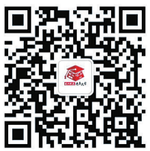
▲株洲晚报老年大学微信公众号