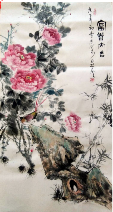
▲国画:《富贵大吉》(作者:颜学习)