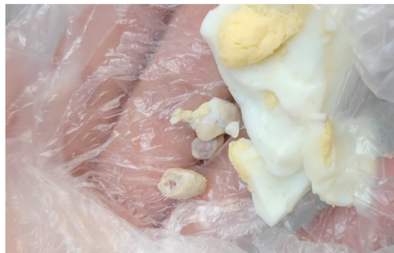
▲鸡蛋里的颗粒物