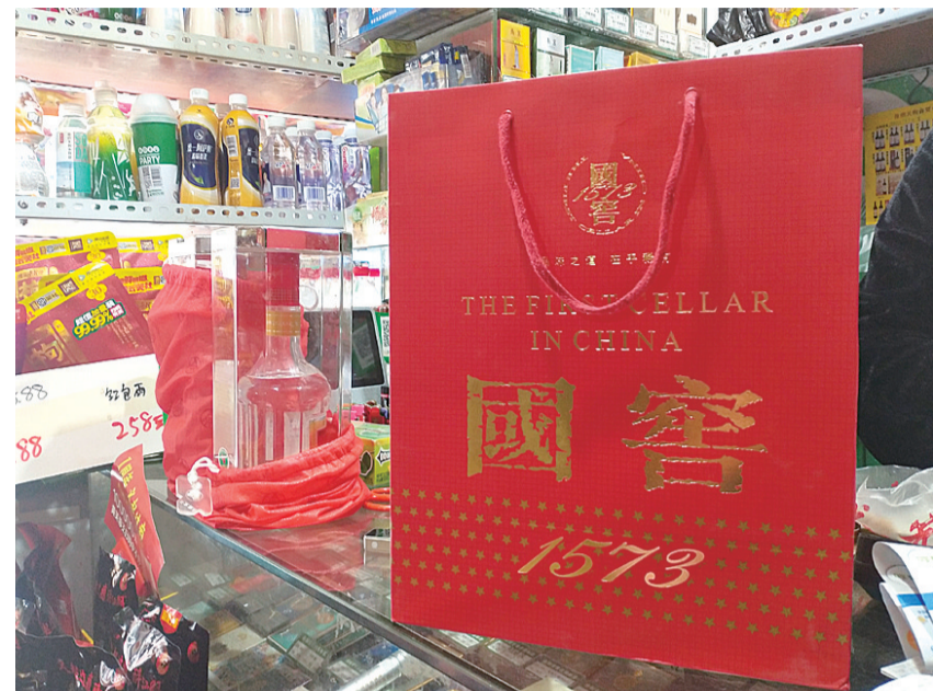
▲唐女士从朱某手中购买的国窖1573品牌名酒

近日,唐女士拨打晚报新闻热线28829110投诉:我在芦淞区盛世路经营烟酒行,2017年买到了一批酒,囤积了3年,今年才发现是假酒,就找到卖酒给我的业务员要求退货,业务员不给退。我报警了,警察说我追诉期已过,无法受理,我现在是投诉无门。