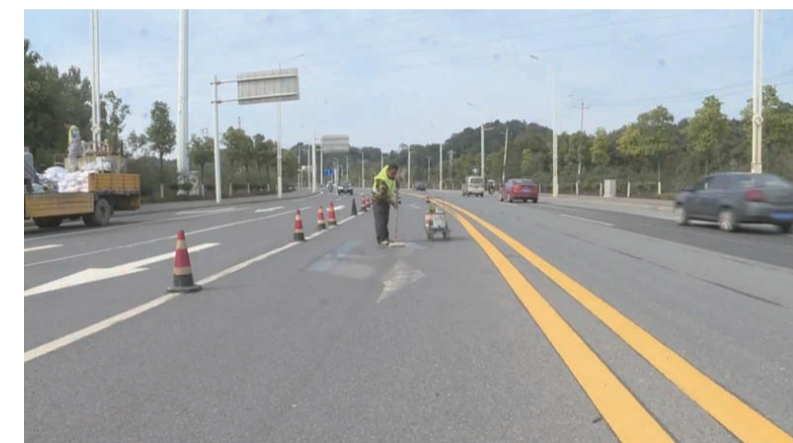
▲芦淞区住建局正组织施工人员重新施划交通标线