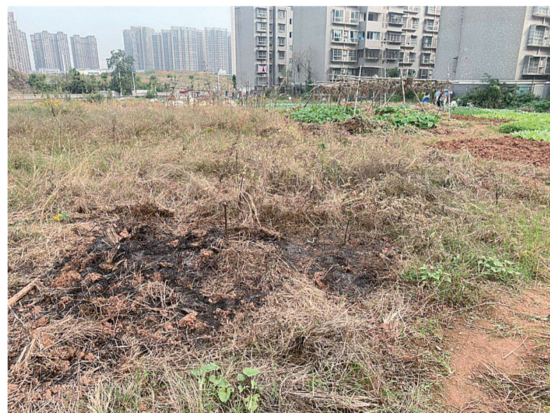
▲“菜园”里留有焚烧痕迹

随后,记者将情况向市生态环境局天元分局进行反映。该局相关负责人表示,将尽快安排工作人员进行现场处理。