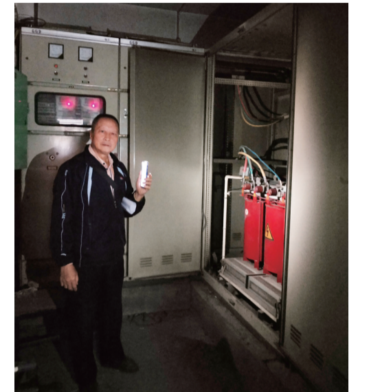
▲变压器室内环境阴暗潮湿

“我们早就不想干了,但这事如果没人来管,水和电的问题都解决不了,我们这栋楼的居民生活只会变得更糟糕。”漆大爷说,他目前最大的愿望就是希望政府部门牵头,给银环大厦进行水、电改造,也像其他小区一样,能做到一户一表。