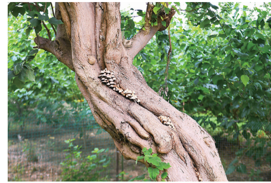
▲岛上具有年代感的老桑树随处可见