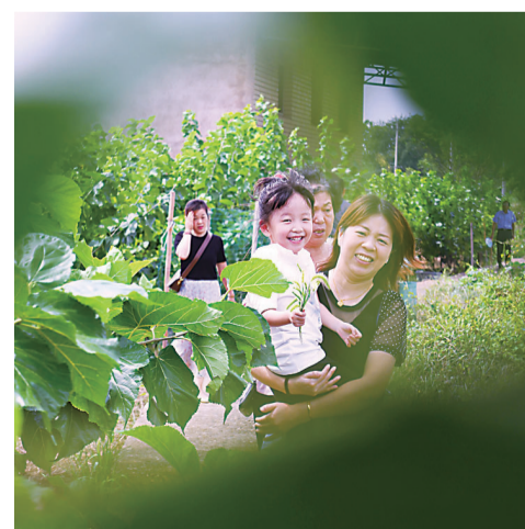
▲游客带着孩子漫步在桑园的小路上