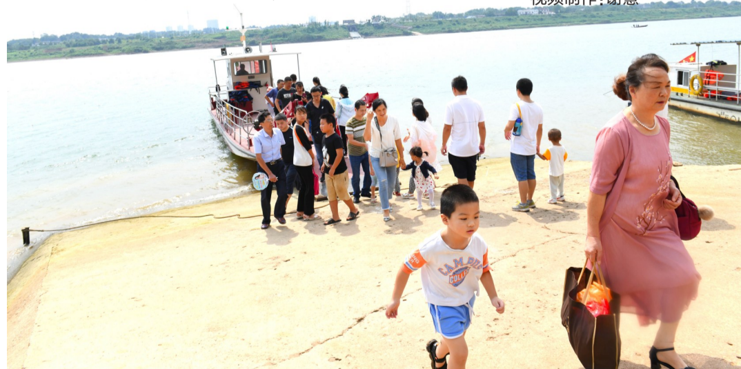
▲渐渐繁忙起来的古桑洲渡口