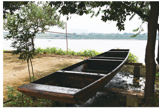
▲上岸的渔船成了岛上独特的人文景观