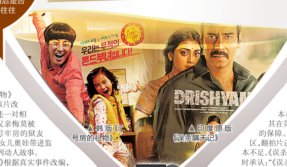
▲韩版《七号房的礼物》