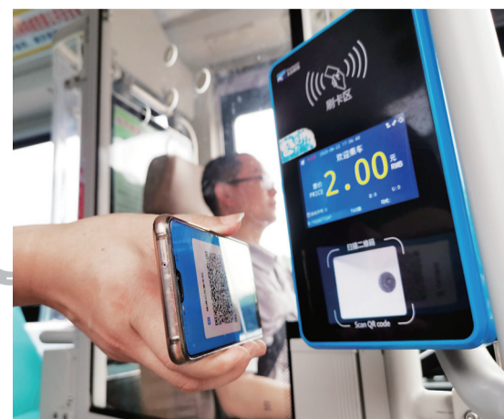
▲“智慧公交”微信扫码乘车,让市民出行更省心

据了解,截至目前,株洲城区1353台公交车中,1329台已换成新能源公交车。带来的不仅是乘车环境的改变,更是整个城市生态环境的提升。据测算,全市电动公交车平均节油率达到了15%,每年可节油220万升,减少碳排放7万余吨。