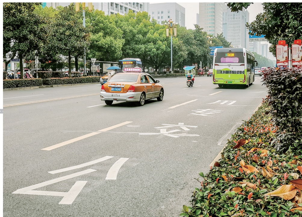
▲保障公交专用车道路权,对公交提速至关重要