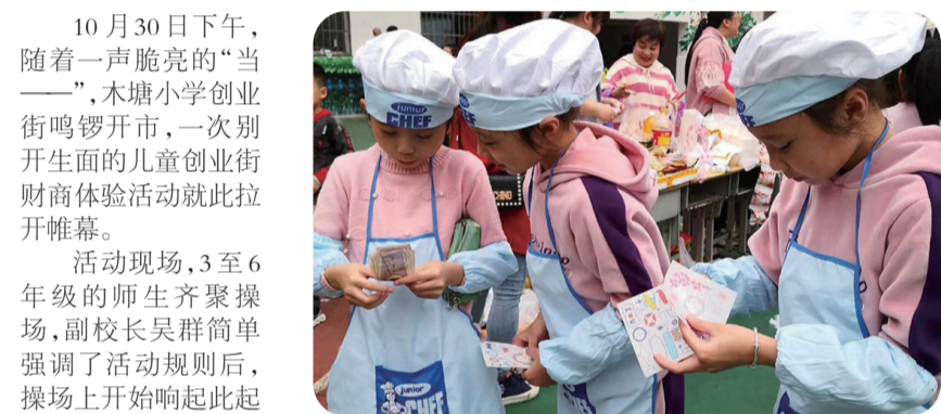
▲美食小摊主开始清点收入

10月30日下午,随着一声脆亮的“当——”,木塘小学创业街鸣锣开市,一次别开生面的儿童创业街财商体验活动就此拉开帷幕。活动现场,3至6年級的师生齐聚操场,副校长吴群简单强调了活动规则后,操场上开始响起此起彼伏的吆喝声、讨价还价声。一眼望去,各班所售的物品从书籍、杂志到布偶、发圈,从蛋挞、凉面到饮料、果盘,再配上五彩缤纷的展板、鲜艳夺目的海报,每个摊位都具有鲜明的特色。前来逛“街”的教师、同学和家长都“淘”在其中,乐在其中。活动后半段,还有许多小摊主按捺不住,开始流动售卖,“老师你尝尝我做的蛋挞吧!”“阿姨这个小夹子很适合你!”……即便是往常性格内敛的孩子,都在努力地推销着自己的商品。