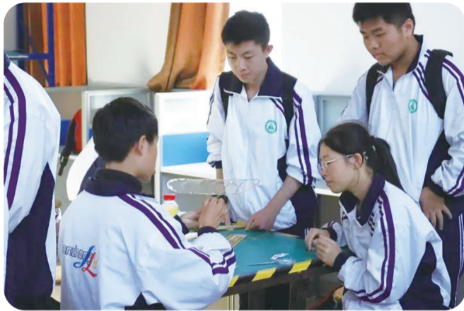
▲学生制作蜻蜓飞机

10月22日至23日,市三中高一至高三全体学生走进韶山航空实践基地,开展科技研学活动。