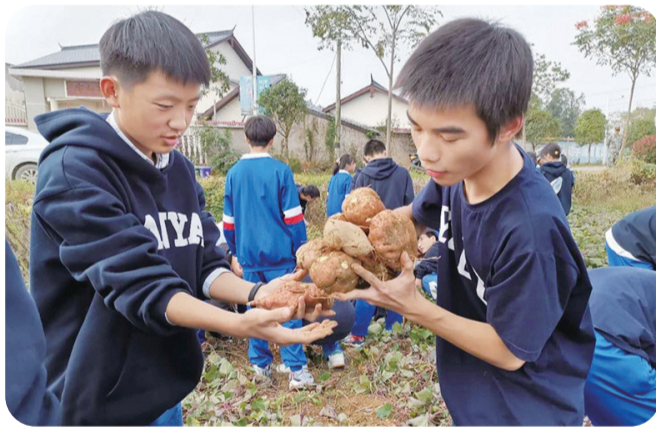
▲学生在田里挖红薯

10月27日、28日,株洲南雅实验中学高一、初二学子分别前往伟人故里韶山,追寻毛主席的足迹。