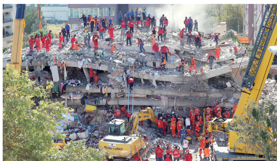
▲10月31日,救援人员在土耳其伊兹密尔省地震灾现场工作

截至11月1日,土耳其西部、希腊东部萨摩斯岛附近的爱琴海海域6.6级地震已导致两国至少53人死亡。其中,土耳其至少有51人死亡、近900人受伤。