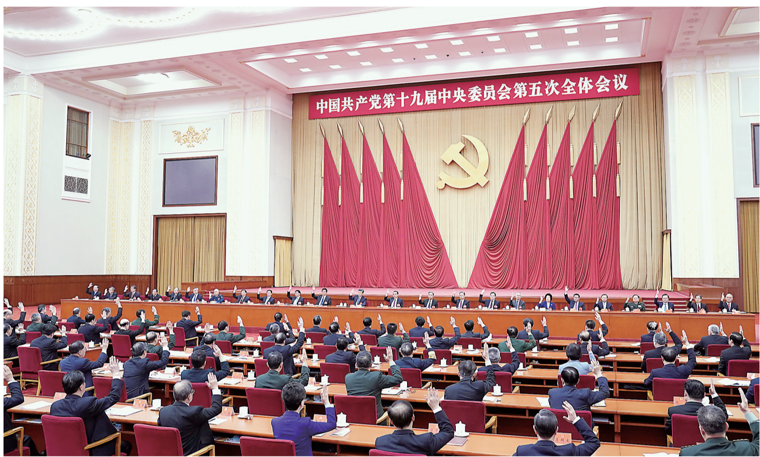
中国共产党第十九届中央委员会第五次全体会议，于2020年10月26日至29日在北京举行。中央政治局主持会议。