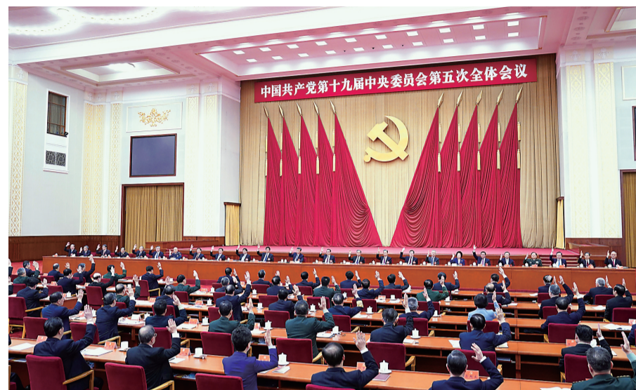
▲中国共产党第十九届中央委员会第五次全体会议,于2020年10月26日至29日在北京举行。中央政治局主持会议。