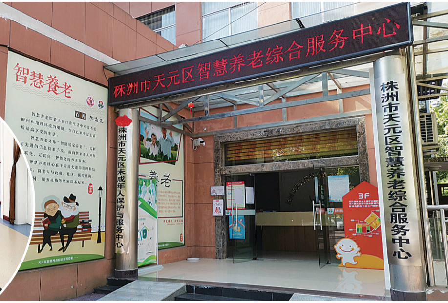
▲去年,天元区智慧养老综合服务中心在嵩山街道挂牌 ▲设在社区里的老年养老院,让群众养老更加便利