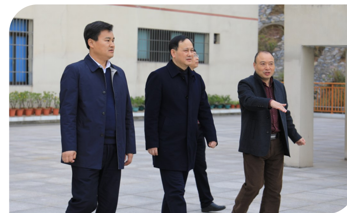
副市长顾峰赴泸溪调研对口帮扶工作