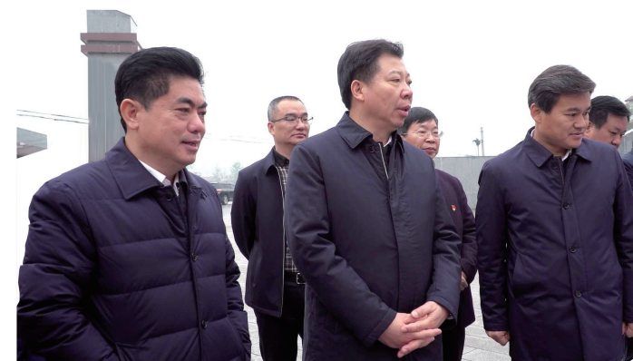
市委书记、市人大常委会主任毛腾飞赴泸溪调研对口帮扶工作

2018年以来,株洲市构建了以天元区、芦淞区、荷塘区、石峰区和株洲经开区与泸溪县武溪镇、洗溪镇、潭溪镇、白羊溪乡、浦市镇结对帮扶新模式,提高帮扶水平。