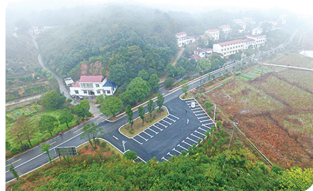
旅游路、资源路、产业路的里程占农村公路总里程的38.5%