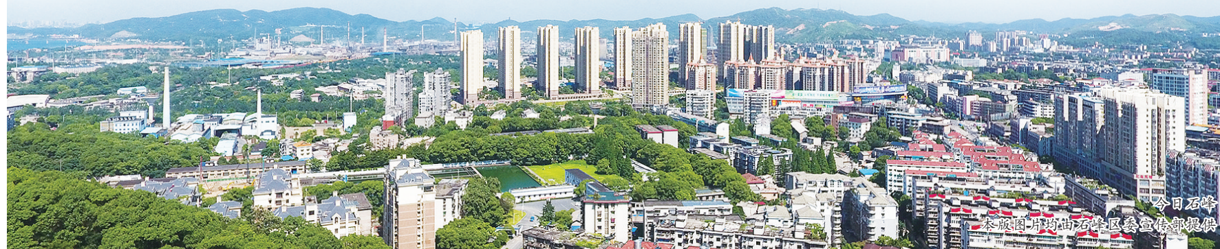
今日石峰

潮平两岸阔,风正一帆悬。数年砥砺前行,项目建设一路凯歌,一个个大项目、好项目,正催生区域实现跨越发展的内生动力,撑起富强美丽幸福新石峰的美好未来!