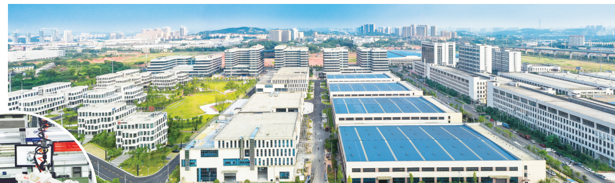
轨道交通创新创业园

根据计划,今年石峰区要实施134个“五个一批”项目,其中重点产业项目32个,完成重点项目投资100亿元以上,让项目成为拉动经济发展的强大引擎。该区摆开“五大战场”,打赢“六场硬仗”,建立三级工作联席会议机制,通过交办件形式,将园区有关工作限时交办至各相关单位,持续掀起项目建设热潮。前9个月,该区计划开工项目17个,实际开工26个,计划竣工项目11个,实际竣工13个。