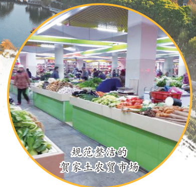
规范整洁的贺家土农贸市场