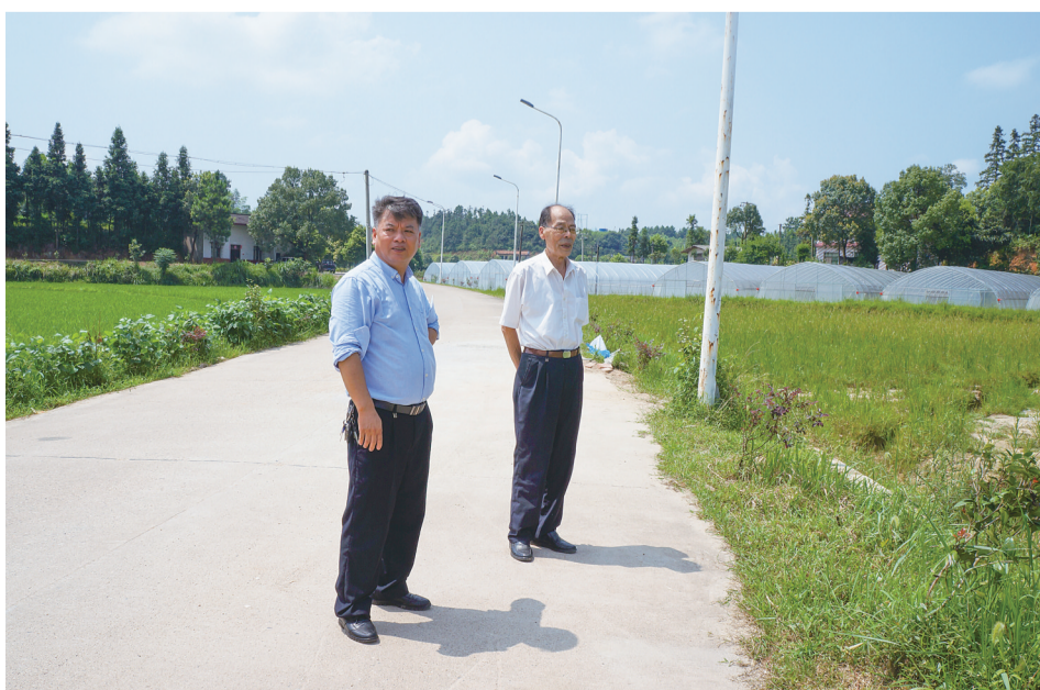
到乡间、到田间地头走访扶贫。