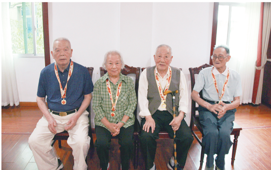
获颁“庆祝中华人民共和国成立70周年纪念章”。