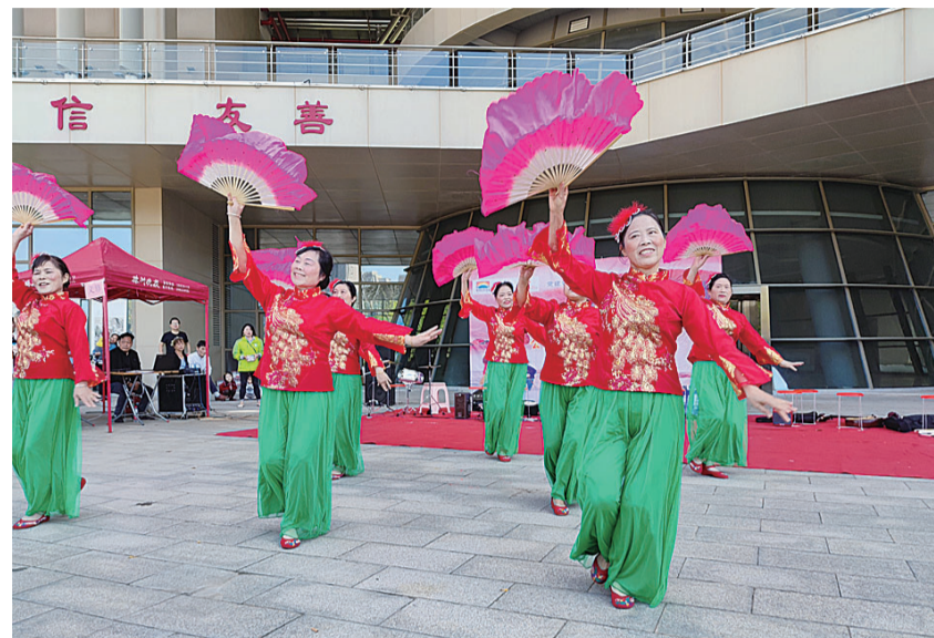
▲韶溪社区的居民歌舞表演,为居民送上重阳节祝福

本报讯(记者杨凌凌)“我爱你中国,我爱你中国,我爱你春天蓬勃的秧苗,我爱你秋日金黄的硕果……”10月24日,天气晴好,在市妇女儿童活动中心的前坪,传出优美的歌声。原来,这是韶溪社区、城发集团乐享护理服务有限公司联合株洲晚报老年大学、株洲为民社会工作服务中心举办的“九九重阳节活动暨老年大学公益课程启动仪式”的现场。