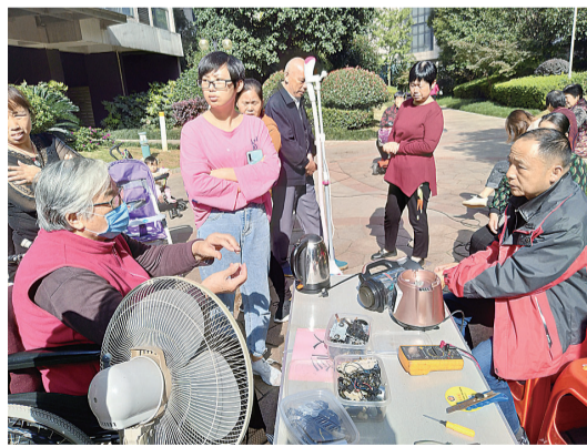
▲株百家电维修师傅为老人维修电器

活动当天,除了晚报老年大学老师和学员带来的非洲鼓、舞蹈、葫芦丝等节目外,大湖塘社区