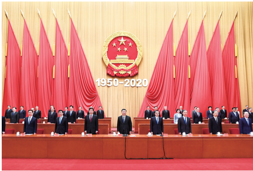
10月23日，纪念中国人民志愿军抗美援朝出国作战70周年大会在北京人民大会堂隆重举行。习近平、李克强、栗战书、汪洋、王沪宁、赵乐际、韩正、王岐山等出席大会。

艰苦卓绝的浴血奋战，赢得了抗美援朝战争伟大胜利。抗美援朝战争伟大胜利，将永远铭刻在中华民族的史册上，永远铭刻在人类和平、发展、进步的史册上。