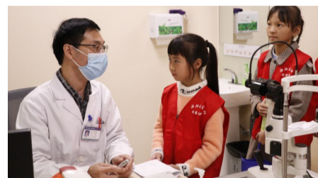
▲校园记者采访茶陵爱尔眼科医院医生

为了增强青少年儿童近视防控的意识,在寓教于乐中认识保护眼睛的重要性,10月17日上午,株洲日报社校园记者俱乐部组织茶陵县40余名校园记者来到茶陵爱尔眼科医院参观学习。