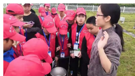
▲校园记者了解醴陵的气候特征