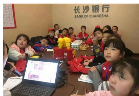
▲“小小银行家”体验银行工作

10月17日,育红小学校园记者走进长沙银行路口支行,参加“小小银行家”体验活动。