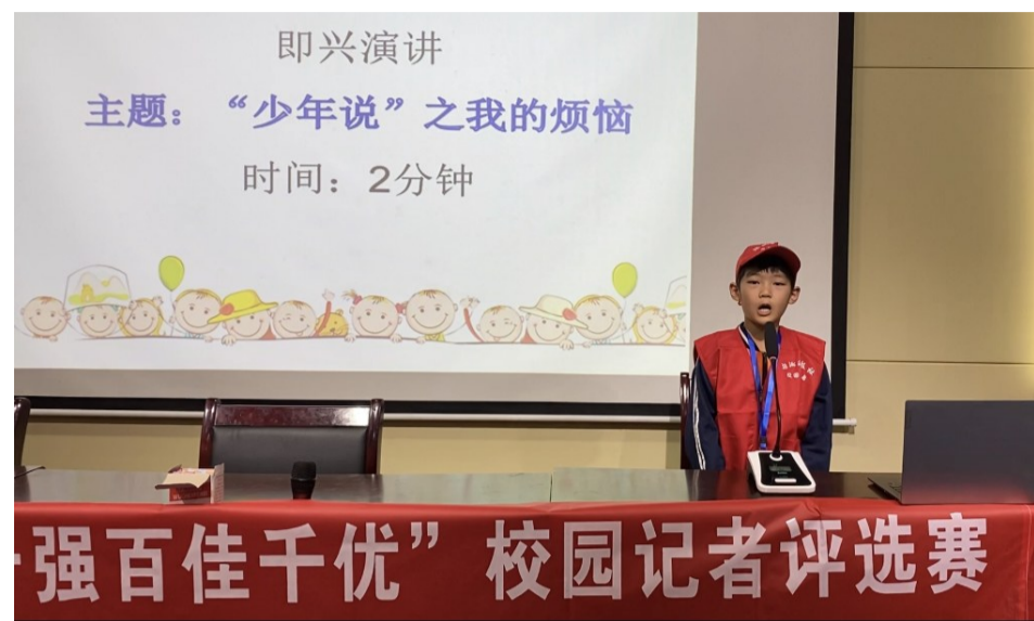
即兴演讲 主题:“少年说”之我的烦恼 时间:2分钟