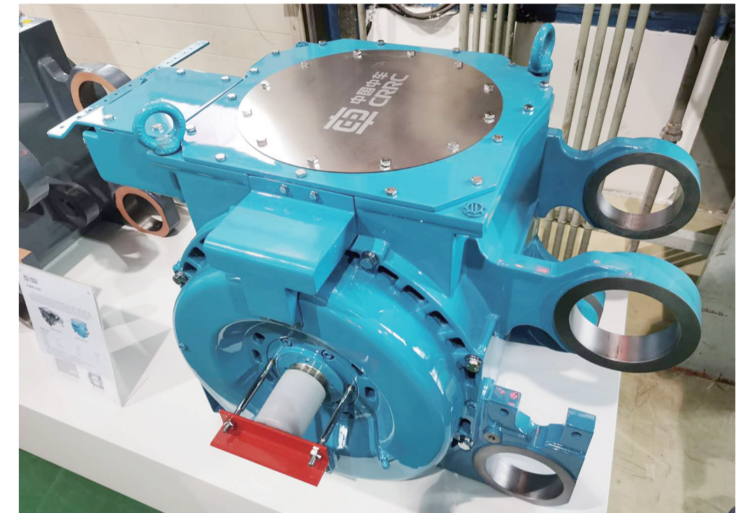
▲中车株洲电机有限公司研制的TQ800永磁同步牵引电机

本报讯(记者 伍靖雯 通讯员 曹书为)10月21日,国家重点研发计划“先进轨道交通”重点专项——时速400千米跨国互联互通高速动车组,在中车长春轨道客车股份有限公司下线,车辆的核心动力装备正是由中车株洲电机有限公司(以下简称“中车株洲电机”)研制的TQ800永磁同步牵引电机。时速400千米跨国互联互通高速动车组,能在不同气候条件、轨距和供电制式标准的国际铁路间顺畅运行,具有节能环保、主动安全、智能维护等特点。