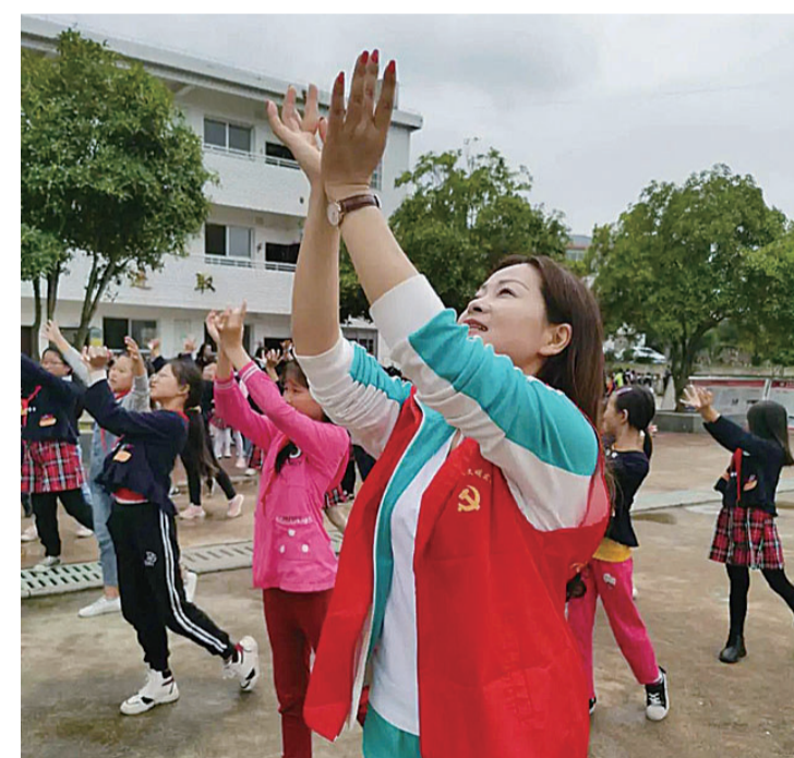
▲支教队为小学生送艺术课

本报讯(记者 肖捷 通讯员 皮灿华 钟晋)近日,由攸县图书馆、文化馆、博物馆、青少年活动中心、业余体校组建的一支下乡支教队,来到了丫江桥镇仙石小学,开展“温情暖山水·艺体乐下乡”文化志愿公益支教活动。