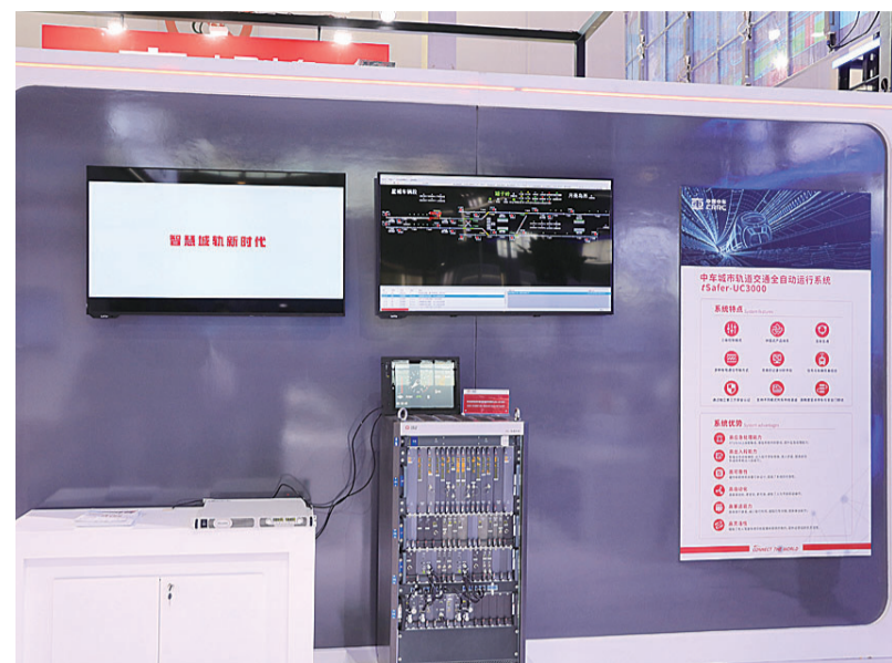
▲株企研制的自主FAO信号系统正式亮相

本报讯(记者 伍靖雯 通讯员 姜杨敏)株企助力“智慧城轨”时代来临。10月21日,2020北京国际城市轨道交通展览会开幕,中车株洲电力机车研究所有限公司(以下简称“中车