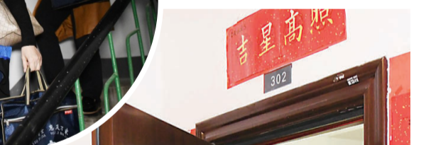
▲信息登记完,居民与工作人员热情告别