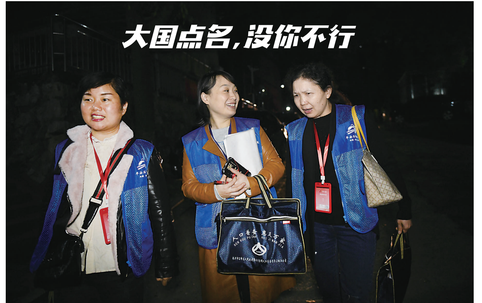
▲由于白天很多居民不在家,普查员们经常需要晚上上门登记信息

新建了大型小区,附近中小学学位配置够不够?一条路上有商超有住宅,停车位要如何规划才合理?要解决好各种与人民群众利益、经济社会发展息息相关的问题,就必须摸清人口“家底”。