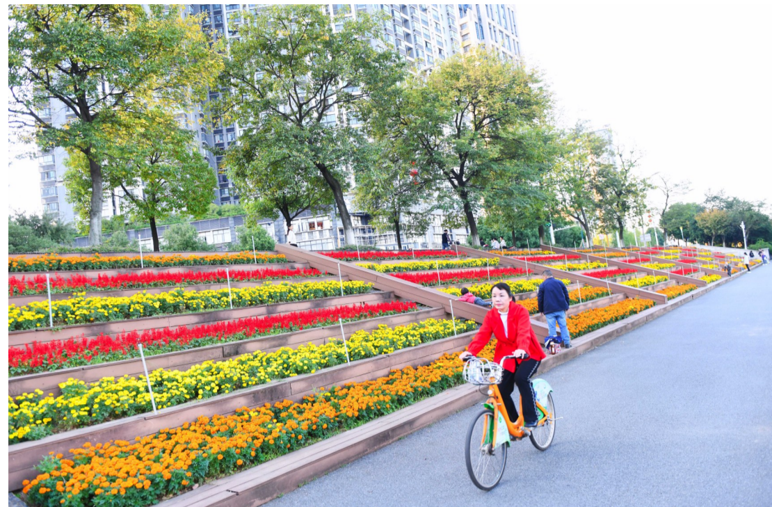
▲10月21日, 河西风光带, 五颜六色的花带成了江边最耀眼的风光