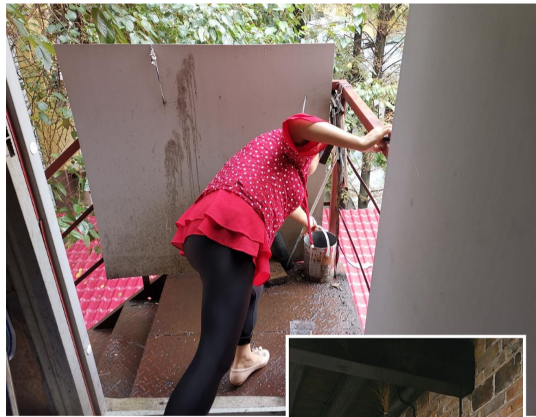
▲▲工作人员正在清扫卫生死角