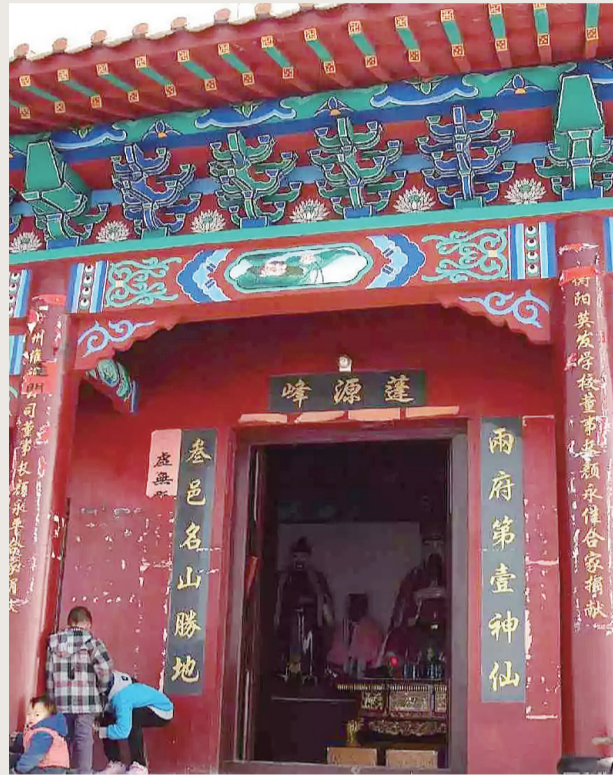
蓬源峰上的蓬源仙寺庙一角

南部则是安仁县军山乡南湖村。这里古时候的行政区划为衡州府安仁县凤江乡益湘里;这里离军山镇上比较远,又有永乐江阻隔,过去交通不便,如今修了公路桥,村民出行方便;这里盛产大蒜、八合,村民经济活跃,生活比较富裕。