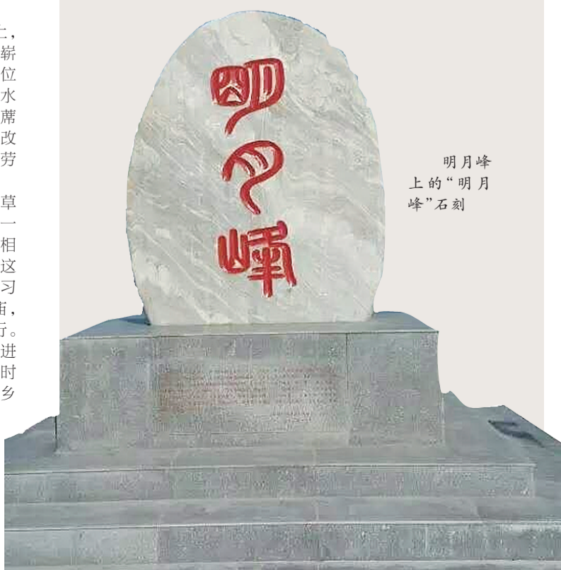
明月峰上的“明月峰”石刻