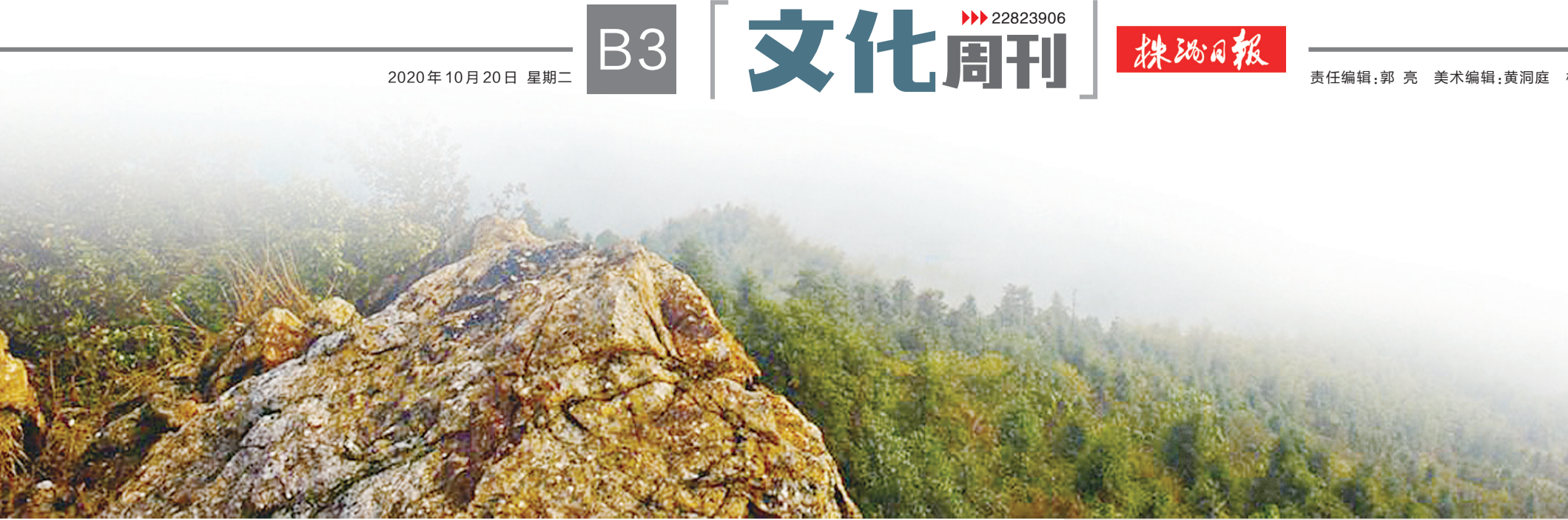
云雾缭绕下的婆婆岩

8月13日,原告陈敦吉、郭寿绥等人带着诉状,上到了长沙府;被告王道元、王庆章随即反诉。两股强劲势力,针尖对麦芒,在省城打起了持久官司。次年三月,沈知县调任别所,续任知县刘曜,奉长沙府令,专程赴庆霞寺实地查勘,4月8日宣判。判后,双方不服。官司捅到了湖南省巡抚院。抚院受理后,觉得蹊跷。速命湘潭、长沙两府合署办案。抚院的组织措施,得到朝廷工部屯田司郎蔡枚功和刑部郎中李章俊的联合支持。7月6日,长沙知府朱益藩开庭,判决“庆霞寺历系公管;仇、匡、王均捐有田,同为施主。王姓不得擅称山主;王姓占造学堂,充为闾邑门学堂,另择正绅接管;王姓新建族祠既已落成,免其拆毁,令出银400两作学堂经费,限一月内缴至案下……”双方当庭签字画押,官司总算尘埃落定。案虽结,王姓赔钱的事,却一直拖到1904年9月,抓捕、羁押了好几个老赖劣绅,才在蔡枚功、李章俊等朝中高官的敦促下,经由新任湘潭县何知县收齐。