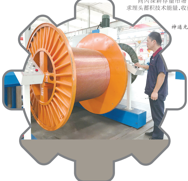
神通光电厂房内,工人们正忙着生产。